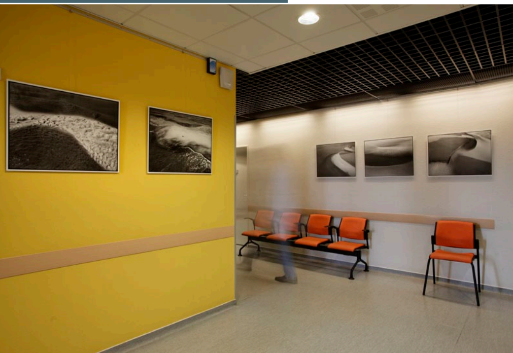
Exposition «Banc et Dunes» de Vincent Monthiers